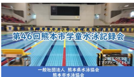
チャンネルQRコード 【熊本県水泳協会】